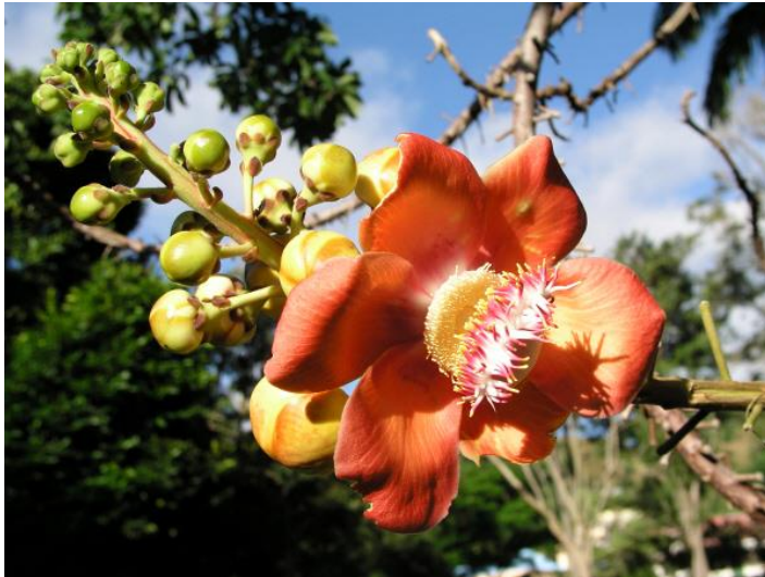
Flor del árbol de las bólas de cañón