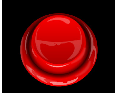
Botón rojo, su uso es esencial

.La lectura continúa cuando el lector lo desea y pulsa el botón rojo o la barra espaciadora.